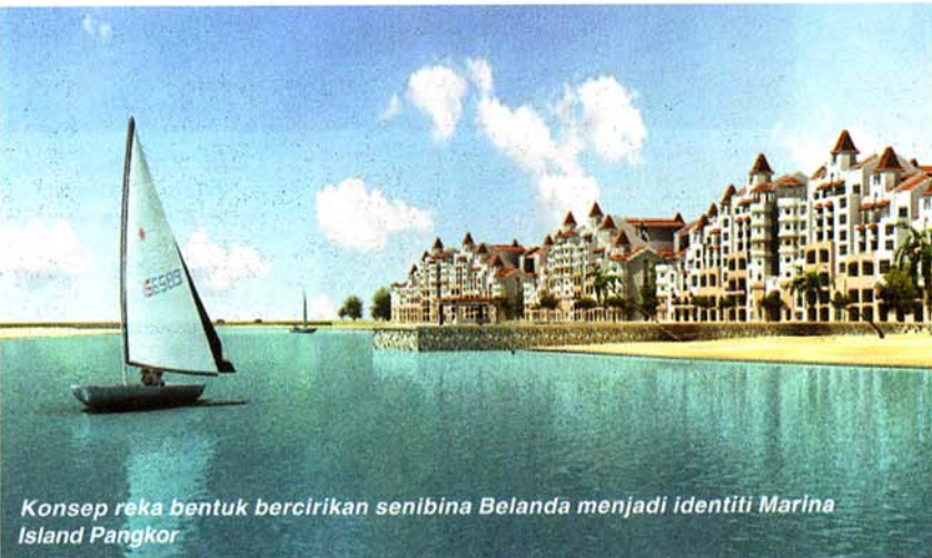
Konsep reka bentuk bercirikan senibina Belanda menjadi identiti Marina Island Pangkor

"Marina Island Pangkor bukan sahaja akan jadi mercu tanda baru di Manjung, bahkan akan meletakkan Perak, khususnya Lumut sebagai destinasi persinggahan kapal-kapal persiaran dari seluruh dunia," ujar Dato' Ding.