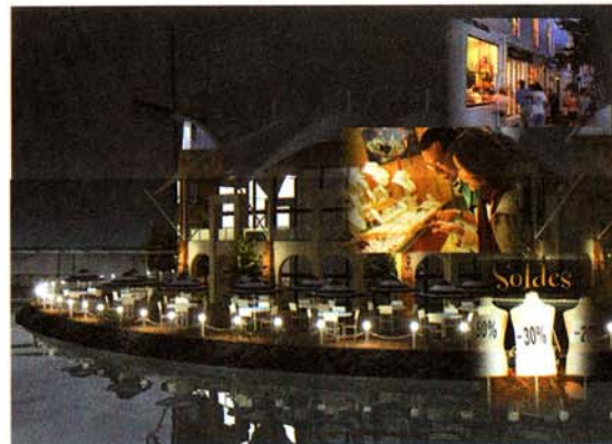
Marina Island Pangkor menyediakan pelbagai kemudahan termasuk pusat membeli belah

Beliau menjelaskan, sebagai sebuah marina bertaraf dunia, Marina Island Pangkor akan menyediakan rumah kediaman, kemudahan perniagaan, rumah kedai, akademi pelayaran, hotel, pusat beli belah dan pusat komersial.