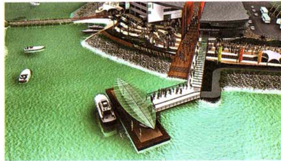
Terminal Jeti Marina Island Pangkor bagi kegunaan domestik dan antarabangsa